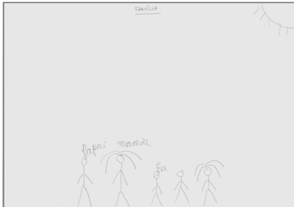
Figura 3. Família real.

mais os membros da família, e o casal parental volta os olhos para o adolescente, muito embora ainda permaneça o traçado desvitalizado da figura palito e a cisão nas pernas.