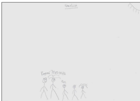
Figura 4. Família ideal.